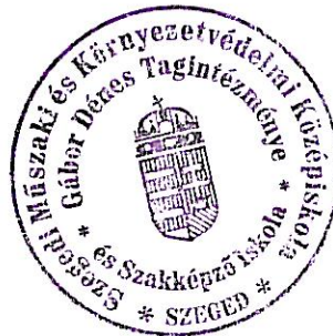
Ábrahám Ferenc igazgató